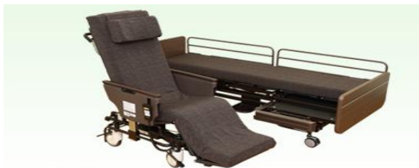
※一部、外観が変更になる場合があります。