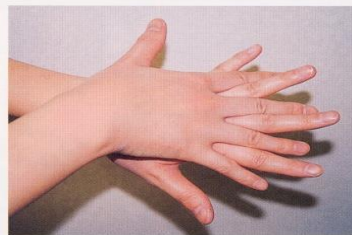
2. 手の甲を伸ばすように洗う