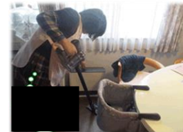
家事支援のイメージ