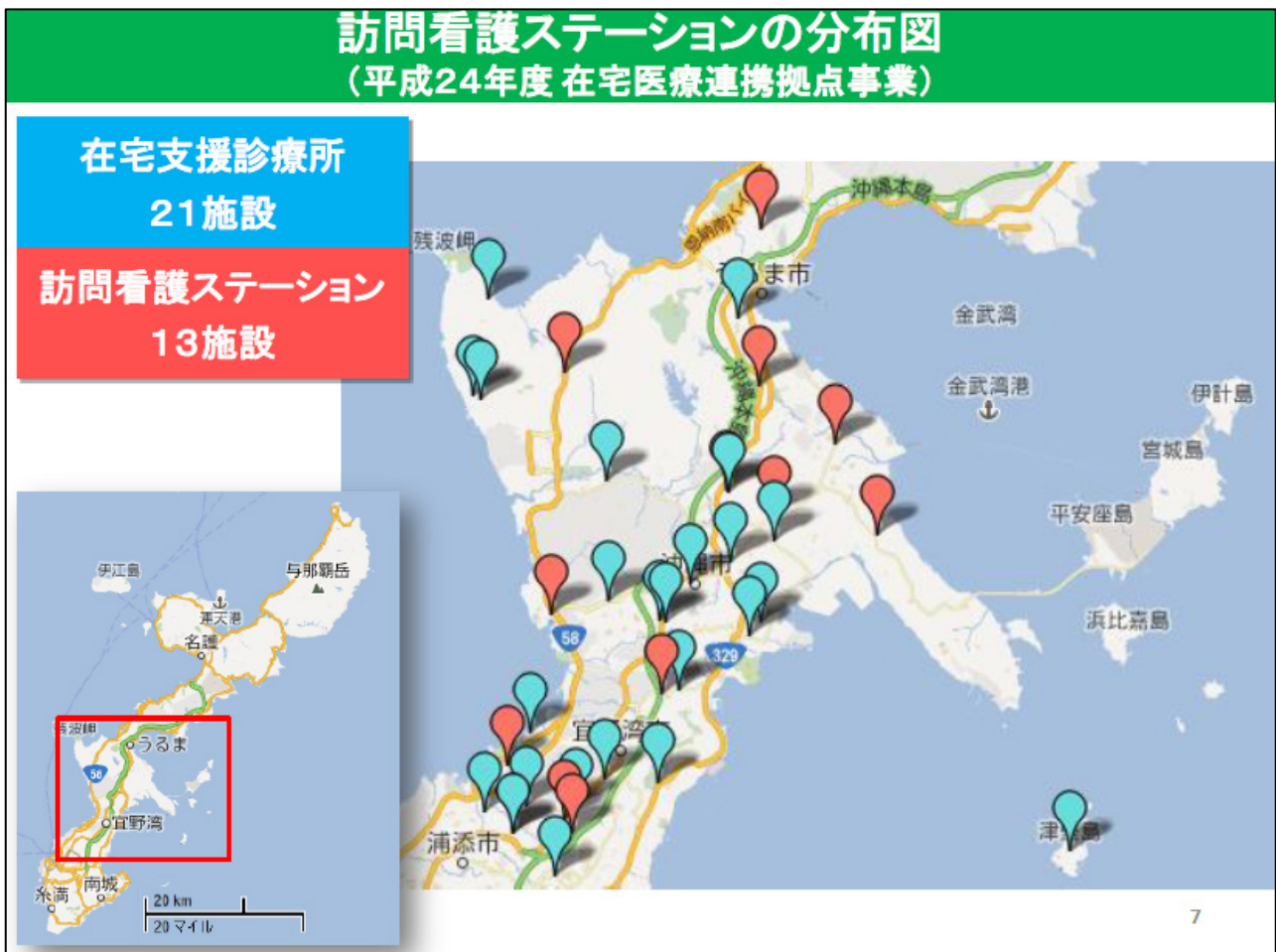
例) 沖縄県 中部地区医師会における医療・介護資源把握の取組み (図 15)

※ 中部地区医師会の作成した資源マップでは、在宅医療・介護に関わる施設の数や地域の分布状況等を一目で把握できる。