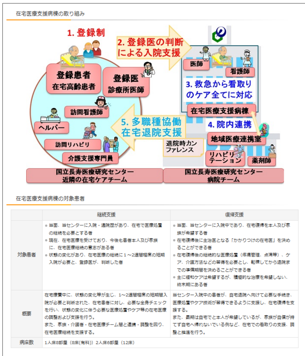
例) 国立長寿医療研究センター 在宅医療支援病棟における取組み (図 25)

※ 国立長寿医療研究センターでは、在宅療養を継続できるよう、患者や家族の安心を担保し、かかりつけ医の負担軽減を目的に在宅療養支援病棟を運営している。